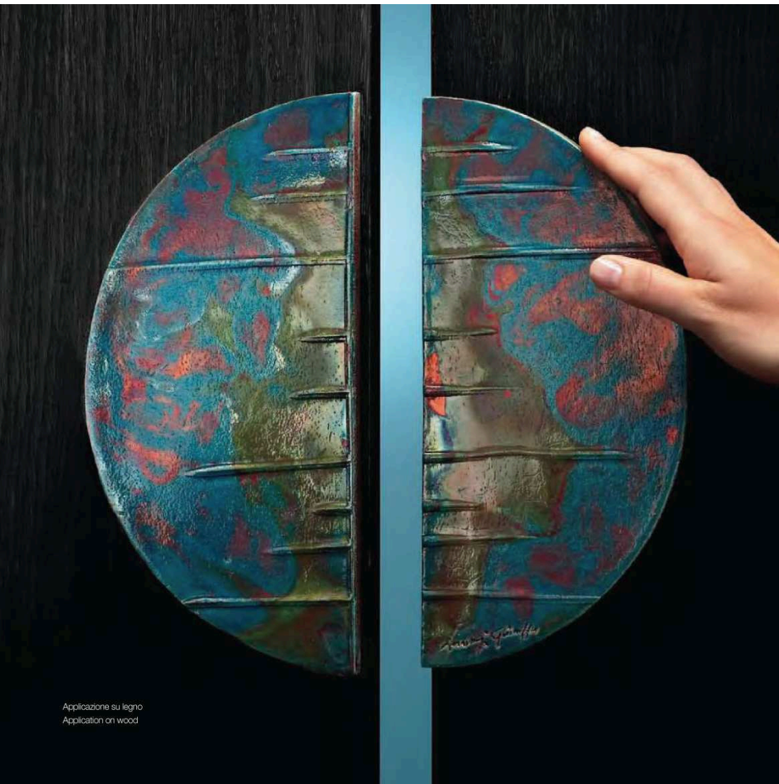
Applicazione su legno Application on wood