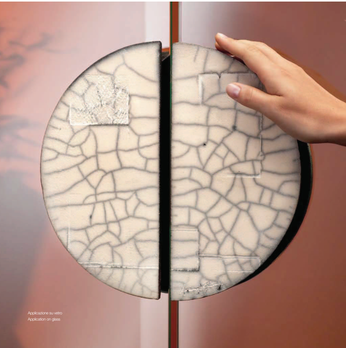
Applicazione su vetro Application on glass